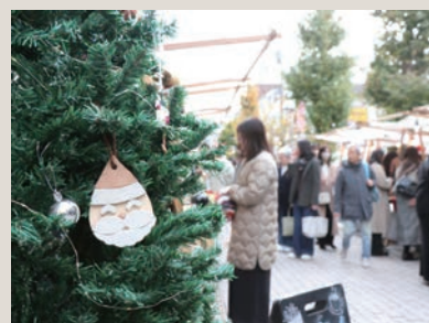
オーナメントは店主さんの持ち寄り!