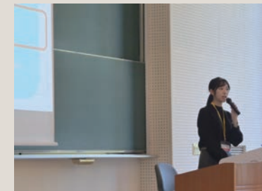
自身の研究について発表する様子

学会発表は学生のうちに達成したいチャレンジのひとつでした。日々多様な研究に取り組む人々がいることを肌で感じられ、そうした積み重ねが社会を変えていくのだと思うと、胸が高鳴るような感覚がありました。