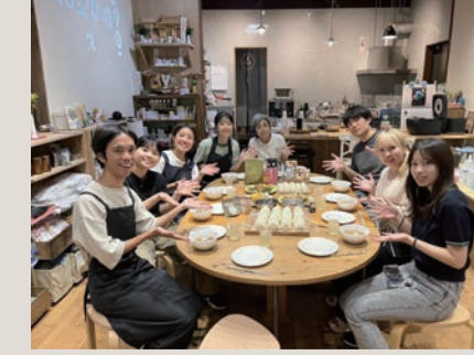
さつま町の食材でご飯会