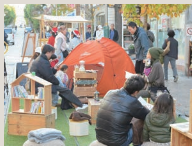
座って本を読んだり、くつろいだり