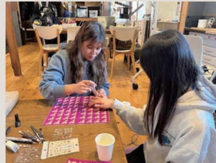
諦めていた気持ちを胸に遊びを実践

利便性が重視され、使い方が固定化される現在のサービス。私たちは暮らしの中でサービスを「遊ぶ」という視点で捉え直し、新たな可能性を探っています。今年度は住民が持ち寄ったモノの物語を共有し、物々交換や物語付きでメルカリ出品を行う「メルカメ」を発展させ、受け身に置かれやすい立場の学生が、自らの視点で遊びつくす実践に挑戦。サービスを想定外に使いこなす中で新たな楽しさを見出しました。現在は、こうした実践を誰もが遊べる形にするための体系化を進めています。