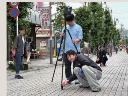
360°カメラで7mおきにデジタルスキャン