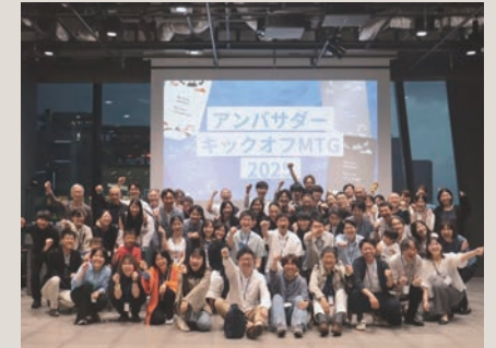
2025年度のアmbasダーキックオフMTG@都内

人口減少、そして移動社会が本格化する中、地域と多様なかたちで関わる「関係人口」が増えています。本研究では、島根県海士町をフィールドに、地域に関わる人々がどのようなウェルビーイング (WB) を実現しているのかを調査しています。今年度は関わり方の深度や複数の領域におけるWBを測る尺度を作成し、アンケート調査を実施しました。131名から回答を得た結果、関わるほどに、より幅広く高いWBを実感していることなどがみえてきました。