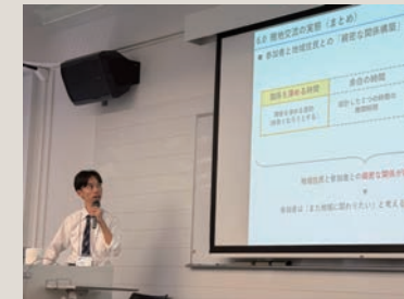
デザインプロジェクトの成果発表

デザインに関わる多様な方との交流を通じ、研究のアドバイスをもらうだけでなく、これまでやってきた活動の良さにも気づくことができました。これからは実践と理論を往復しながら進めていきたいと思った時間でした。