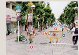
104箇所の損傷状況を特定