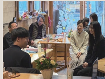
チーム家族が集まり合同で新年会を開催

Child Care Commons (CCC) は、社会関係資本（ソーシャルキャピタル）に着目し、血縁関係のない第三者が信頼関係に基づいて子どもの育ちに関わる仕組みを構築するJSTの研究プロジェクト。核家族化の進行により孤立しがちな子育てに、多様な担い手が関与することでウェルビーイングな社会の実現を目指しています。地域の親子と第三者による「チーム家族」の実践が4年目となる今年度は、関係を持続させる支援の在り方を検討し、都心部で働くワーカー向けのワークショップも実施しました。