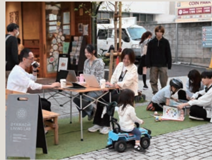
好きなことを、好きな場所で