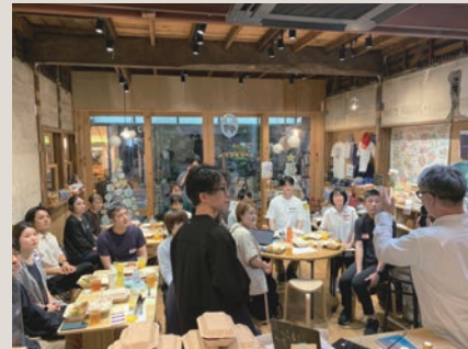
7月にキックオフイベントを開催

本研究では、効率や収益性が優先され、人と人との関係性が生まれにくいリテール（小売）の現状を背景に、お店を資本主義の「市場」ではなく、地域の人々がフラットにつながる「市場」として再考します。リテールの可能性を多義的に捉え直し、お店を軸に新しい価値交換の仕組みを探りました。商店街でのフィールドワークやタタタハウスでの活動に参加して調査を行い、7月には『リリテールインスピレーションブック』を制作。更に関係者を集めたイベントを開催し、今後の可能性を議論しました。