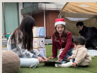
子どもも大人も、みんな一緒に!