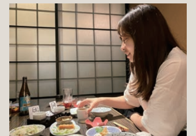
美味しい地酒「死神」に出会いました