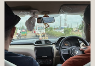
Uberが移動の命綱。条件交渉は大変！