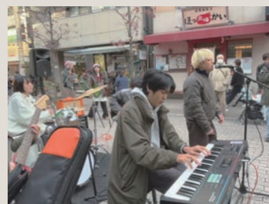
素敵な音楽に思わず足を止めたくなる!