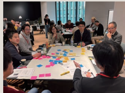
不登校に関わるステークホルダーが集うWS

OHcCLL (オークル) は、アカデミアや大学病院、リビングラボなど地域の産学官民が連携し、誰もがウェルビーイングに暮らせる社会の実現を目指しています。今年度は医療分野の課題から「不登校の未来」をテーマに、医師や当事者家族、教育関係者へのインタビューやワークショップ(WS)を実施しました。その結果、不登校は家庭・学校・地域など複数の要因が関係し、立場の異なる関係者が信頼のもとでつながる場や、学びの選択肢を広げる取り組みが重要だと分かりました。