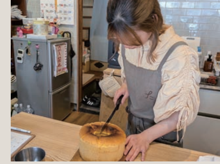
学生が作ったお菓子を提供

tatata laboratoryは、学生がまちのなかで「やりたいこと」を仲間と試行錯誤しながら実現する“実験場”がコンセプトの学生コミュニティです。水曜日にタタタハウスで運営するカフェ「tatata cafe laboratory」は、4年目を迎えた今年度、山形県金山町のお土産開発に挑戦。大学生2人がMCをする「めぐてらじお(仮)」の他、全国各地の地域との関わりを持つ学生たちによる「ワカまちまっくんぐプロジェクト」が発足し、世田谷トラストまちづくりの助成を受けて、まちとの関わりを紹介するイベント企画を行っています。