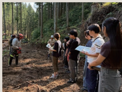
森林組合による伐採を見学

＜ハッピーロードのリビング化に向けた研究＞ リビングのような空間をどうつくるか考えたとき、私たちは木材に注目しました。木のぬくもりは、知らない人同士の間にも静かな余白をつくります。そんな木材との縁を探して、私たちは川場村の森を訪れました。そこに広がっていたのは資源としての木材ではなく、命ある生き物としての木でした。慈しみ育てて誰かの暮らしへ届けようとする、林業の人々の営みと願いが息づく森でした。そんな愛おしい木たちを尾山台に持ち帰り、ベンチやキーホルダーをつくりました。それが川場から来た木だとわかると、途端に会話が弾み、川場の森とのつながりが日々、まちに広がっていきます。