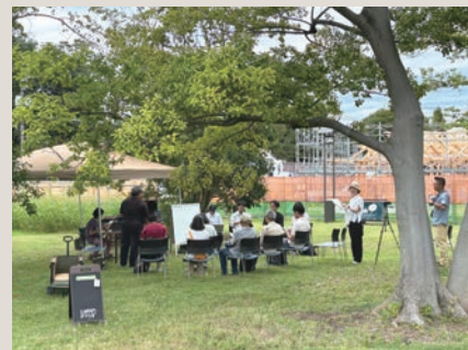
植物の手入れ方針も住民参加で議論

「玉川野毛町パークらぼ」は、区民が公園の運営に参加し緑豊かな環境を守り育てながら様々な活動ができる、百年先を見据えた新しい公園運営のかたちを目指す取り組み。2021年始動当初から坂倉教授が伴走し、区の間支援組織が区民主体の活動を支える体制が整えられてきました。いよいよ2026年夏に拠点施設が完成し全面開園を予定。様々な利用者が訪れるようになると、標準的で無難な運営を望む声も上がるかもしれませんが、この公園から豊かな暮らしが育まれるよう、対話と試行錯誤を重ねながら伴走を続けます。