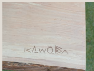
オリジナルロゴが入る川場村木材のベンチ