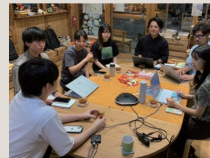
商店主や学生などでメディアづくり