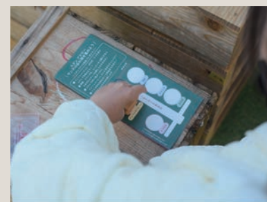
イベント全体を巡るスタンプラリー