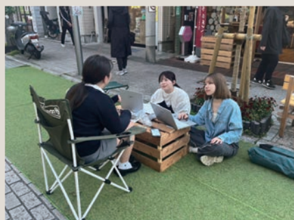
尾山台で暮らす高校生にインタビュー