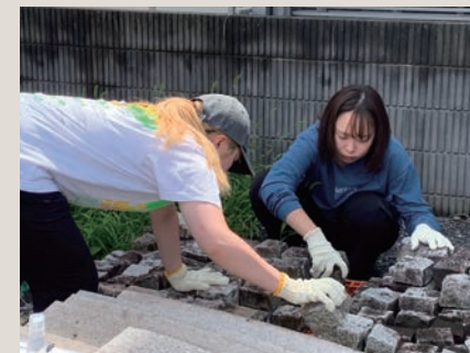
商店街が確保している石材の数を確認

＜石畳コモンズの醸成に向けた研究＞ ショッピングプロムナード事業により1988年に生まれ変わったハッピーロード尾山台商店街は、尾山台地域のシンボルとして約40年にわたり親しまれてきました。しかし、石畳舗装の街路は長年の使用により劣化が進み、持続的な維持管理が課題となっています。そこで、これまでの維持管理の方法や石材の在庫状況を調査するとともに、今後の補修計画を支援するため石畳全体のデジタルデータを作成しました。石畳の景観が続いてきたのは商店街と世田谷区土木部の協定に基づく双方の努力あってのことで、様々な負荷がかかっている実情がわかってきました。石畳が、地域全体で大切に手入れをする「コモンズ」になっていくように、今後も継続して大学や地域住民も維持管理に貢献できるような仕組みを検討、実装していきます。2026年1月には様々な人たちが石畳に関心をもち情報共有できるコミュニティ「石畳ファンクラブ」を立ち上げました。