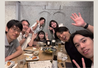
学会に参加した多様なメンバー